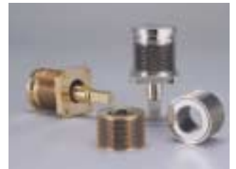
表面処理品ベローズ(めっき品) Bellows with any Plate