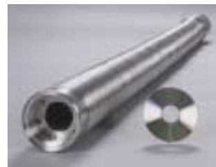
長尺用ベローズ Long Bellows