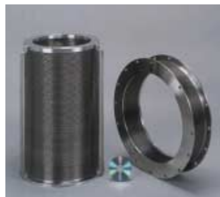
大径ベローズ Large Bellows