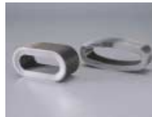
異形ベローズ Race Track Bellows