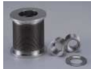
表面処理品ベローズ(電解研磨品) Electrolytic Polished Bellows

Rod Seals Joints Valves Accumulators Coupling Mechanical Seals